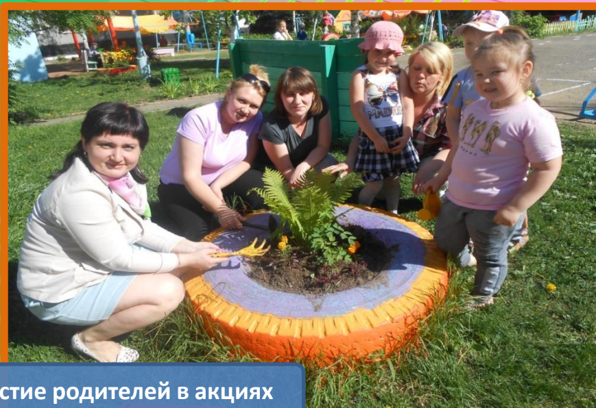
Участие родителей в акциях