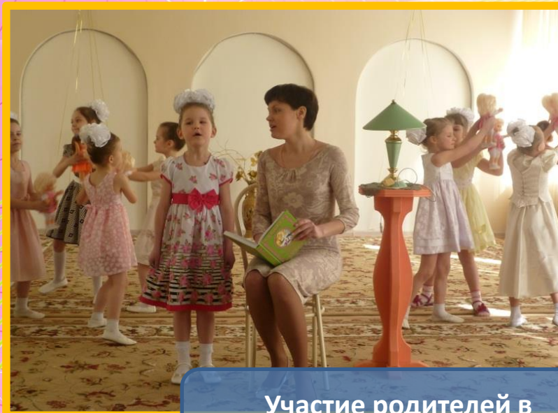
Участие родителей в совместных праздниках