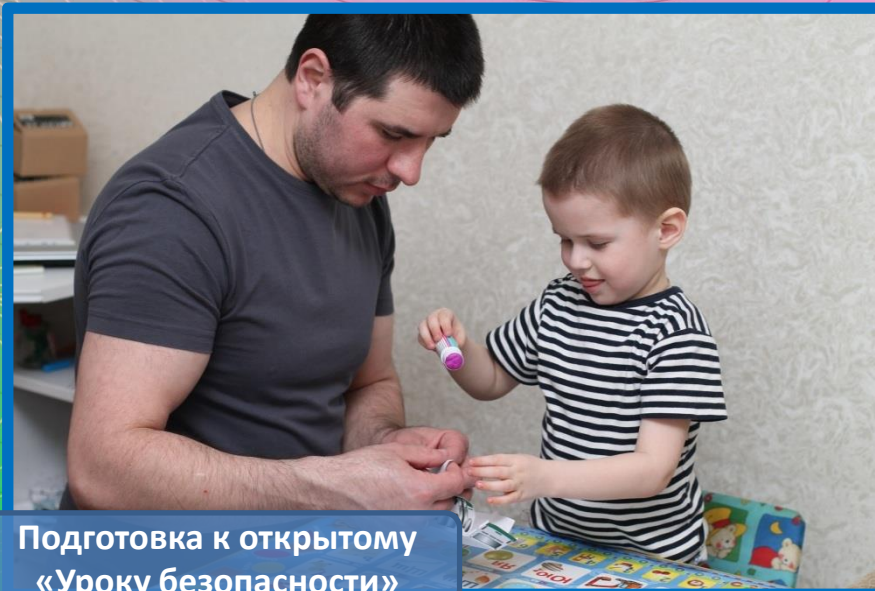
Подготовка к открытому «Уроку безопасности»